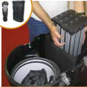
1 המתקן וחלקיו הוצאת המתקן מהמארז