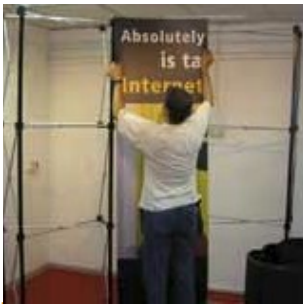
4 הפאנל האמצעי מוצמד ראשון ואחריו הצדדיים