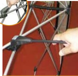
6 התקנת המנורות, בחלק העליון של הפופאפ