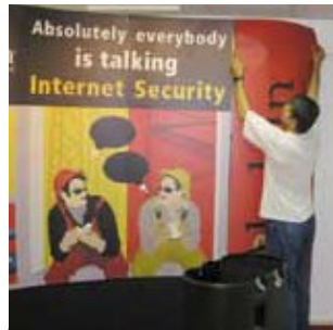
5 הצמדה והידוק הפאנלים הצדדיים