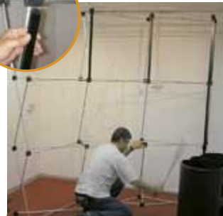
3 הרכבת בארים קידמיים ואחוריים